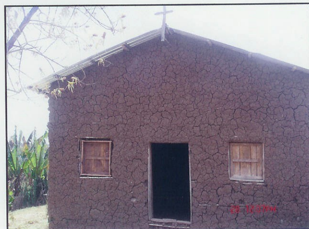
6.000 kr räcker för att ge den nya lilla församlingen ett plåttak till den första kyrkan.