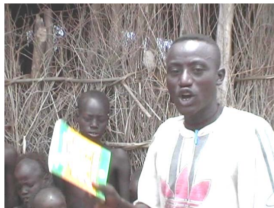
Bejene med ABC undervisning hos Kwegu folket.j